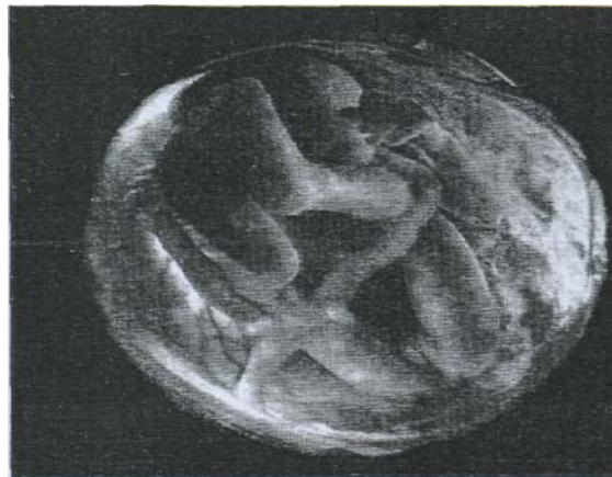
Feto di 20 settimane

DALL'8 SETTIMANA FINO ALLA NASCITA DIFFERENZIAMENTO SESSUALE ALLA FINE DEL SECONDO TRIMESTRE SIA IL CERVELLO CHE IL SISTEMA RESPIRATORIO HANNO RAGGIUNTO UN BUON LIVELLO.