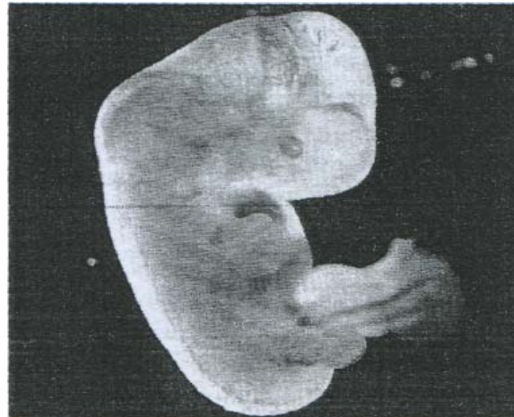
Embrione umano all'età di cinque settimane

INIZIA LA FORMAZIONE DEL SISTEMA NERVOSO E DEL CUORE CHE COMINCIA A BATTERE